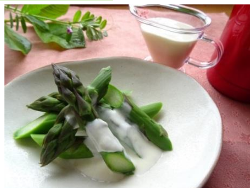
アスパラのヨーグルトソースかけ

*当院の食事にも「乳和食」を取り入れており、新庄病院ホームページでも紹介しています。そちらも是非ご覧ください！