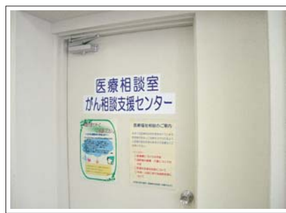
がん相談支援センター 医療相談室